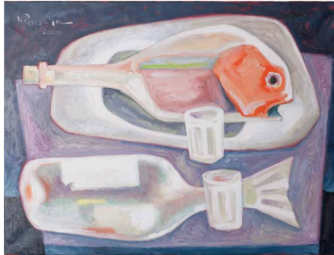
Fische 2000 (Sammlung R. und P. Leimbach)